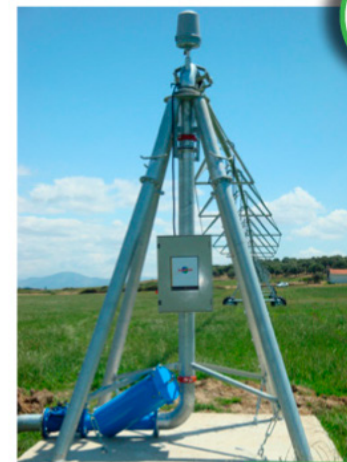
CENTRO CIRCULAR mod. AS 6500

Fácil montagem Totalmente em ferro galvanizado de elevada qualidade