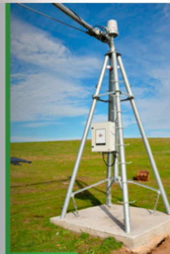
CENTRO CIRCULAR mod. AS 4100