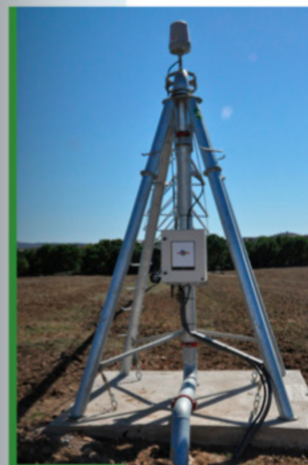
CENTRO CIRCULAR mod. AS 5500

A SUNPOR oferece soluções viáveis para qualquer tipo de terreno.