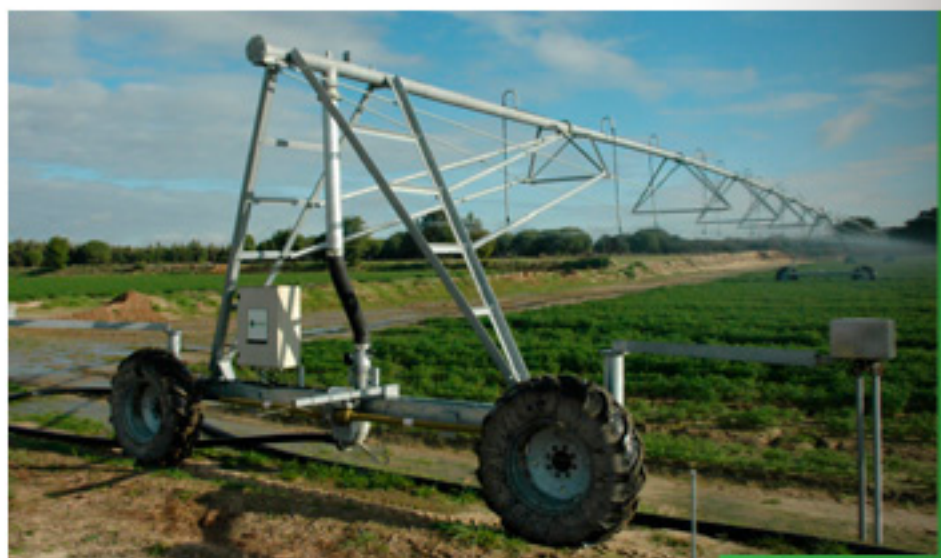
PIVOT LATERAL DE 4 RODAS

A solução ideal para médias e grandes distâncias / áreas Centro de grande tracção totalmente em ferro galvanizado de elevada resistência e durabilidade